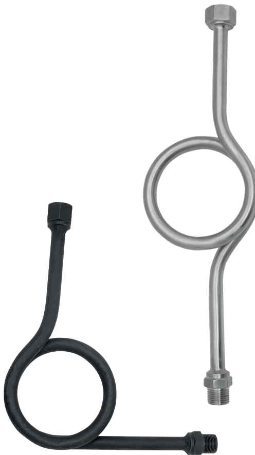
Угловая петлевая трубка 90°